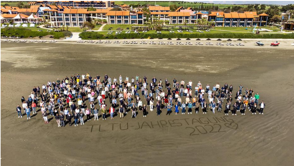
Mit den Füßen im Sand: 200 TLT-Urlaubsreisen-Partner (TLTU) erlebten vier Tage auf Zypern.